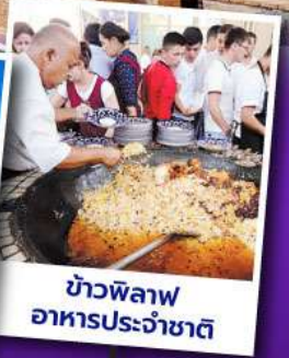
ข้าวพิลอฟ อาหารประจำชาติ