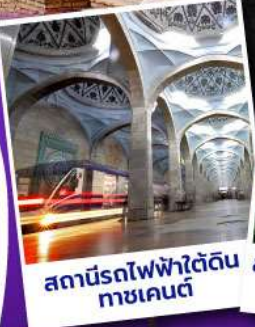
สถานีรถไฟฟ้ใต้ดิน ทาชเคนต์