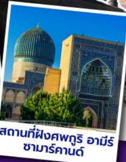
สถานที่ฝังศพกูรี อามิร ซามาร์คานด์