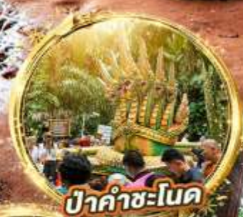
ป่าคำชะโนด