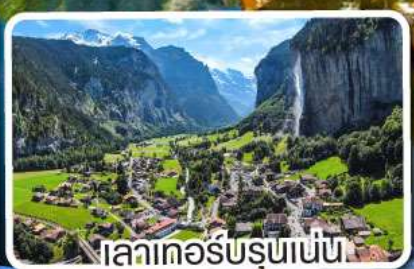
เลาเคอร์บรุนเนน

เดินทาง 12-18 มี.ค. 68 25 เม.ย.-01 พ.ค. 68