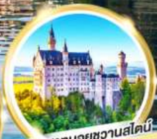
ปราสาทนอยชวานส์ไตน์