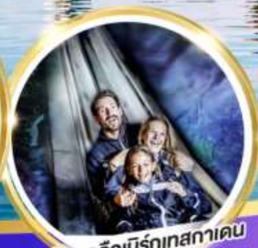
เหมืองเกลือบิรท์เทสกาเดิน