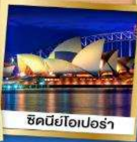
ซิดนีย์โอเปร่า