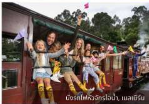
นั่งรถไฟหัวจักรไอน้ำ, เมลเบิร์น