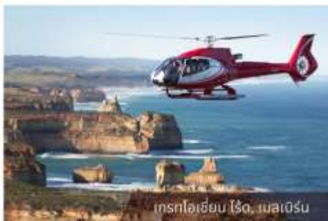
เที่ยวไฮลิคอปเตอร์, เมลเบิร์น