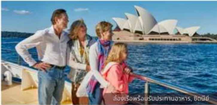
ล่องเรือพร้อมรับประทานอาหาร, ซิดนีย์