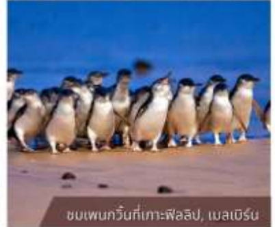
ชมเพนกวินที่เกาะฟิลลิป, เมลเบิร์น