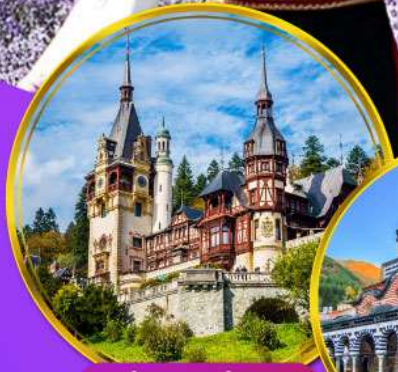
ปราสาทเปเลส