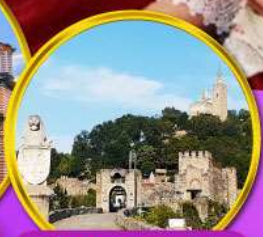
ป้อมชาเรเวทส์