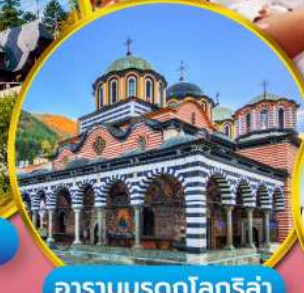
อารามมรดกโลกริล่า