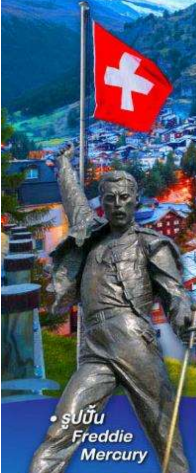
• รูปปั้น Freddie Mercury

พีชิต 5 เวกริก, เวกฮาร์เคอร์คุม, เวกจุงเฟรา เวกลาซีเยร์ 3000 และ เวกรอนเนือร์แกรต