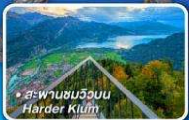
• สพานหินวิวอน Harder Klum