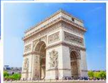
ประตูชัยปารีส