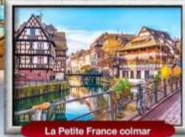
La Petite France colmar

บินหรู สายการบิน Full Service | พิเศษ! หอยแอสคาโก้