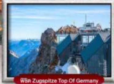
พิกัด Zugspitze Top Of Germany