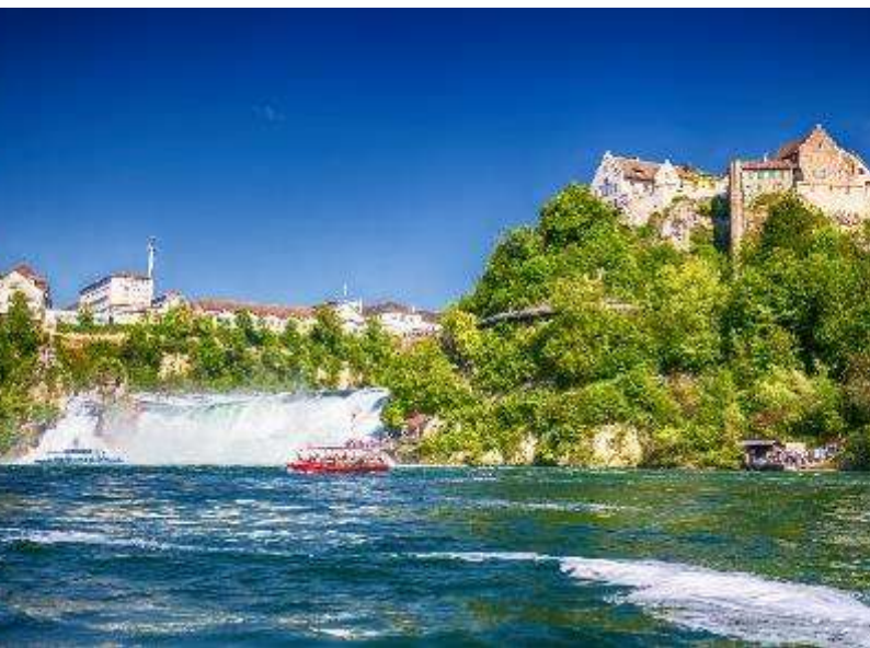
น้ำตกไรน์

ที่ตั้งของ น้ำตกไรน์ (Rhine Fall) ซึ่งเป็นน้ำตกที่ใหญ่ที่สุดในยุโรป นำท่านชมน้ำตกไรน์ (RhineFall) น้ำตกที่ใหญ่สวยงามและตื่นตาตื่นใจซึ่งเกิดจากแม่น้ำไรน์ทิ้งสายไหลผ่านหน้าผากกว้าง 150 เมตร จึงเป็นน้ำตกขนาดใหญ่ที่สุดในยุโรปและได้ชื่อว่าเป็นน้ำตกที่สวยงามที่สุดในยุโรปกลางด้วย อีสระให้ท่านได้ชื่นชมความงามของน้ำตกและถ่ายรูปตามอัธยาศัย จากนั้นนำท่านเดินทางต่อสู่ เมืองสไตน์ อัม ไรน์ (Stein am Rhien) เมืองเล็กๆที่ตั้งอยู่ระหว่างทะเลสาบคอนสแตนซ์ (Lake Constance) กับทะเลสาบซูริค (Lake Zurich) ในเมืองเต็มไปด้วยภาพวาดสีเฟรสโกลดหลวยสวยงามตกแต่งอยู่ตามผนังกำแพง นำท่านเข้าสู่จัตุรัส Rathausplatz จุดไฮไลค์ของเมืองที่เป็นที่ตั้งของศาลากลาง โดดเด่นด้วยถนนแคบๆ อาคารบ้านเรือนสีสันสดใส และสถาปัตยกรรมเก่าแก่ล้อมรอบด้วยอาคารครึ่งไม้ที่สวยงาม