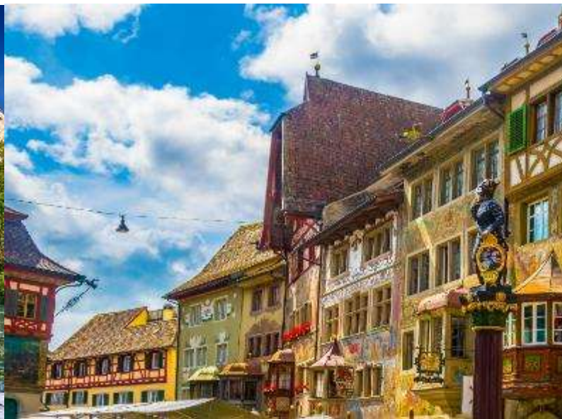
บรรยากาศเมืองสไตน์ อัม ไรน์

นำท่านเดินทางสู่ กรุงเบิร์น (Bern) ซึ่งได้รับการยกย่องจากองค์การยูเนสโกให้เป็นเมืองมรดกโลกในปี ค.ศ. 1863 นอกจากนี้เบิร์นยังถูกจัดอันดับอยู่ใน 1 ใน 10 ของเมืองที่มีคุณภาพชีวิตที่ดีที่สุดของโลกในปี ค.ศ.2010 นำท่านชมบ่อหมีสีน้ำตาล (Bear Park) สัตว์ที่เป็นสัญลักษณ์ของกรุงเบิร์น นำท่านเดินลัดเลาะสู่ถนนจุงเคอร์นกาสเซ (Junkerngasse) ถนนที่ได้รับการอนุรักษ์ไว้อย่างดีในย่านเมืองเก่า มีบ้านอาคารสไตล์บาโรกตอนปลาย นำท่านแวะถ่ายรูปกับวิหารเบิร์น (Bern's Minster) วิหารสไตล์โกธิคที่สูงที่สุดในประเทศสวิตเซอร์แลนด์ ถูกสร้างขึ้นในปี ค.ศ. 1421 ประตูกจะมีภาพที่บรรยายถึงการตัดสินครั้งสุดท้ายของพระเจ้า จากนั้นเดินสู่ถนนแครมกัชเชอ (Kramgasse) นำถ่ายรูปกับบ้านไอน์สไตน์ (Einsteinhaus) บ้านเลขที่ 49 ที่อัลเบิร์ตไอน์สไตน์เคยอาศัยอยู่ที่นี่ เมื่อครั้งมาทำงานเป็นผู้ตรวจสอบของสำนักงานสิทธิบัตรของสวิส ช่วงปี ค.ศ.1902-1905 จากนั้นชมหอนาฬิกาดาราศาสตร์ (Zytglogge) อายุ 800 ปี ที่มี “โซว์” ให้ดูทุกๆ ชั่วโมงในการตีบอกเวลาแต่ละครั้ง นำท่านเดินชมมาร์กาสเซ (Marktgasse) ที่เต็มไปด้วยร้านดอกไม้และบูติก เป็นย่านที่ปลอดภัย จึงเหมาะกับการเดินเที่ยวชมอาคารเก่าอายุ 200-300 ปี