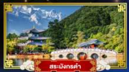
สระมิงกรดำ