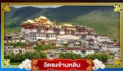
วัดชงจ้านหลิน