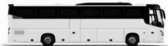
ตัวอย่างรถทัวร์ 1 คัน

ค่าที่พักตามที่ระบุในรายการหรือเทียบเท่าระดับเดียวกัน (พักห้องละ 2 ท่าน) หากประเภทห้องพักท่านริควงมาเป็นอีก เช่น ริควงห้องพักเป็น TWIN BED หรือ DOUBLE BED ทางบริษัทขอสงวนสิทธิ์ในการปรับประเภทห้องพัก เป็นตามที่โรงแรมมีอยู่ โดยไม่ต้องแจ้งให้ทราบล่วงหน้า