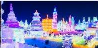
เทศกาลโคมไฟน้ำแข็ง