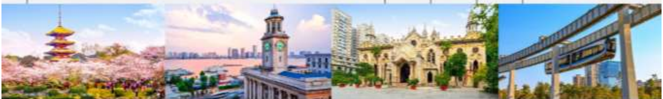
สวนชาทุระทะเลสาบโมซานตงหู