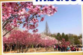
ซากุระ สวนหยูหยวนถาน

จ่ายราคาเดียว..เที่ยวเต็มอิ่ม ..ไม่ลงร้านช้อปปิ้ง