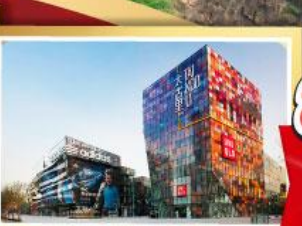
ช้อปปิ้ง SANLITUN