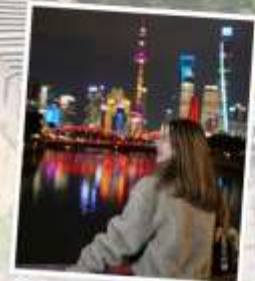
เซี่ยงไฮ้ คลาสสิก ไนท์