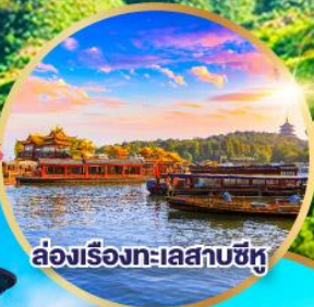
ล่องเรือทะเลสาบซีหู