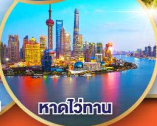
หาดไว่ทาน