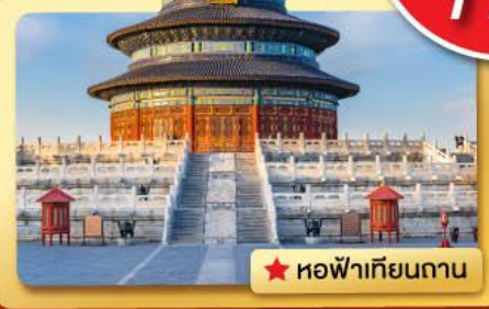
★ หอฟ้าเทียนถาน