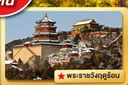
★ พระราชวังฤดูร้อน