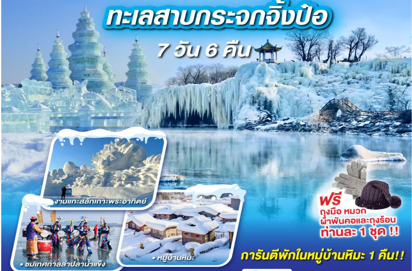
งานแกะสลักเกาะพระอาทิตย์