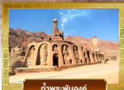
ก้ำพระปันองค์