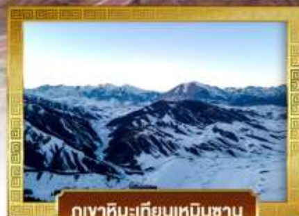
ภูเขาหิมะเทียนเหมินซาน

เดินทางโดยสายการบินโซน่าชาท์เทิร์นแอร์ไลน์