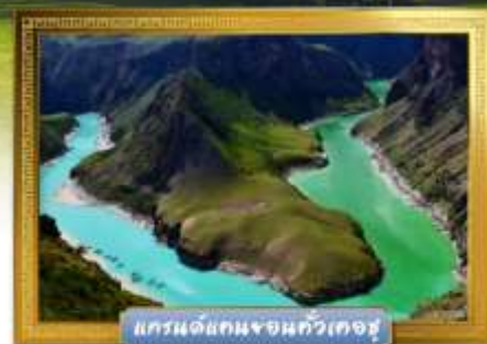
แกรนด์แคนยอนจอนกัวเคอซู

เดินทางโดย : สายการบินโซนาเซาเทิร์นแอร์ไลน์