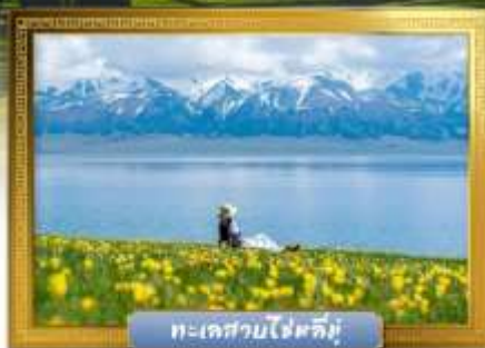
ทะเลสาบไซหลิมู่