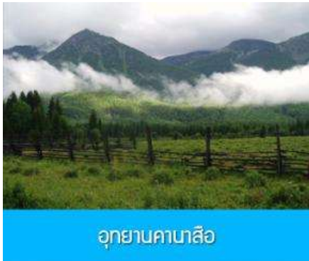
อุทยานคาบาสือ