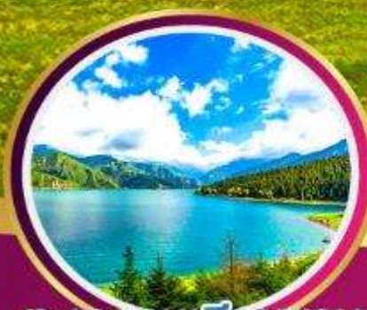
ทะเลสาบเทียนชาน