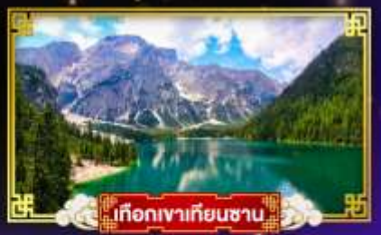
เกือกเขาเทียนชาน