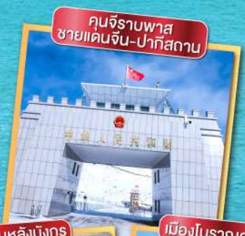
คุณจิราบพาส ชายแดนจีน-ปากีสถาน