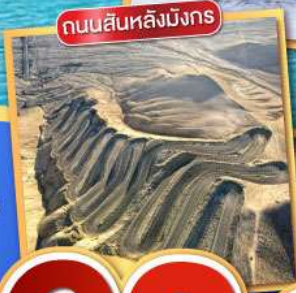
ถนนสีหลังมังกร