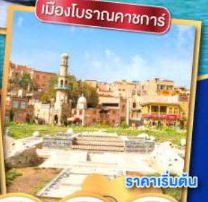
เมืองโบราณคาซกการ์