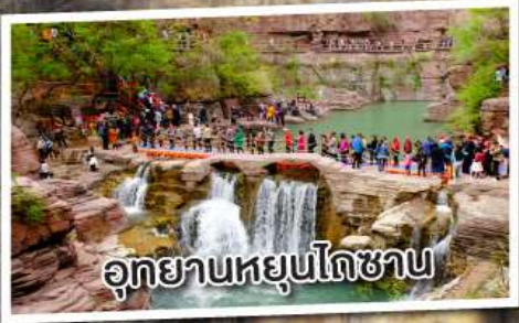
Yungo Shan Park