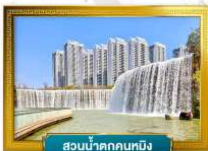
สวนน้ำคกุนหมิง