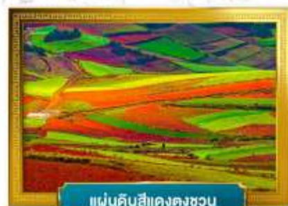
แผ่นดินสีแดงตงชวน