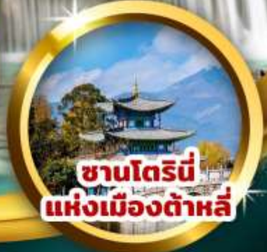
ซานโตรินี แห่งเมืองต้าหลี่