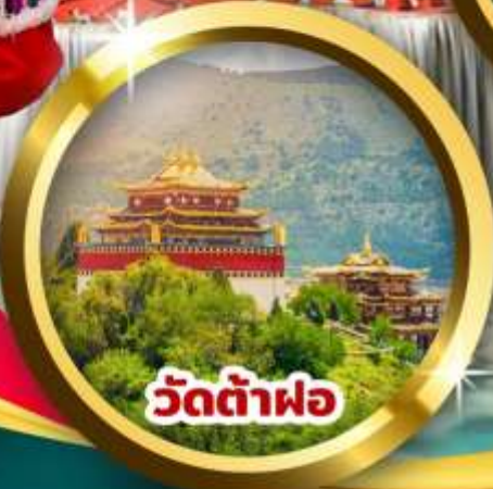
วัดต้าฝอ