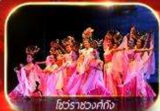
โชว์ราชวงศ์ถัง

สัมผัสความยิ่งใหญ่อลังการกองทัพจีนสี่ฮ่องเต้ นักรบไฟความเร็วสูงทะลุเมืองโบราณ ย้อนตำนานประวัติศาสตร์จีน