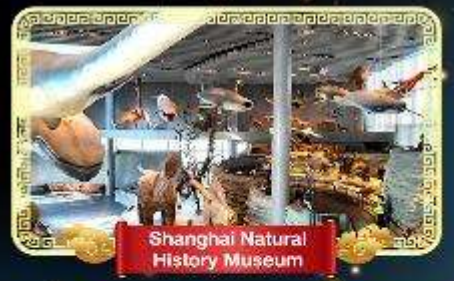
Shanghai Natural History Museum