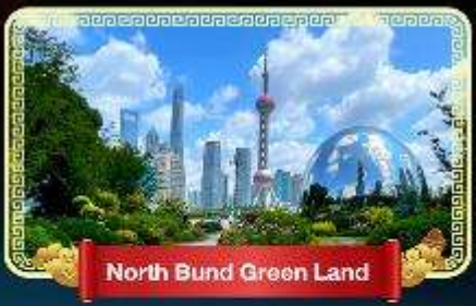
North Bund Green Land