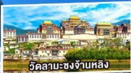
วัดลามะชงจ้านหลิง