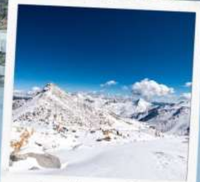
ภูเขาหิมะการ์เซีย ท่ากู่ปิงชวน