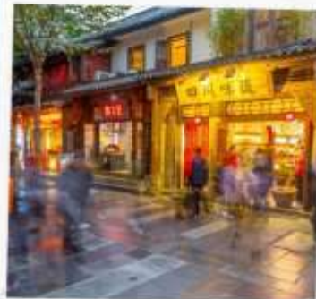
ถนนชอยกว้างแคบ