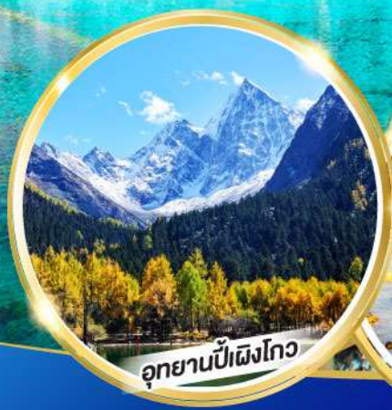
อุทยานปี่ผิงโกว