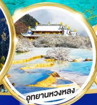
อุทยานหลวงหลง