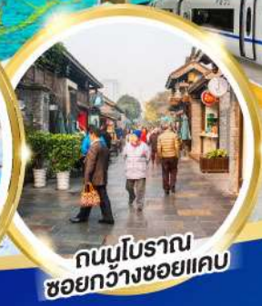
ถนนโบราณ ซอยกว้างซอยแคบ