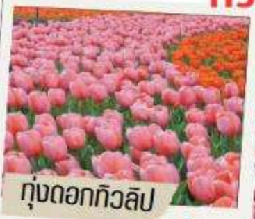
ทุ่งดอกทิวลิป