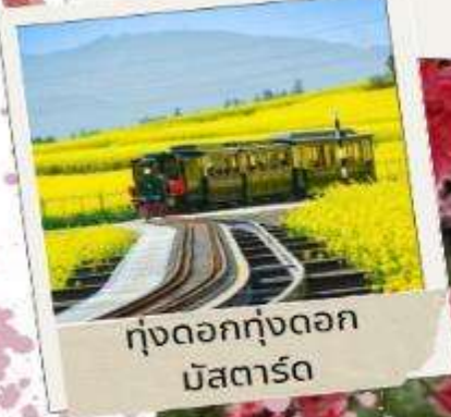
ทุ่งดอกทุ่งดอก มัสตาร์ด