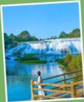
น้ำตกโต่วพั่วถาง