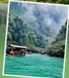
อุทยานต้าซีโขง