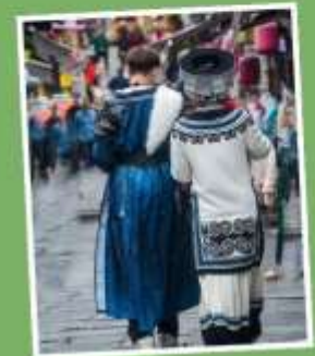
เมืองโบราณซิงเหยียน