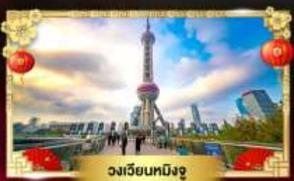
วงเวียนหมิงจู่