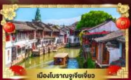
เมืองโบราณซูเจียเจียว

สนุกเต็มพิกัด "สวนสนุกดิสนีย์แลนด์เซี่ยงไฮ้"