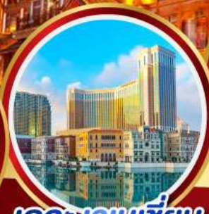
เดอะเวเนเชียน