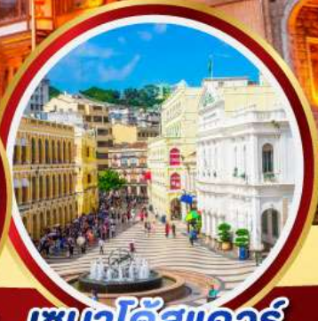
เซนาโดสแควร์