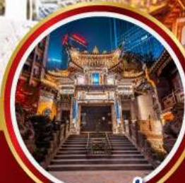
วัดหลัวอัน