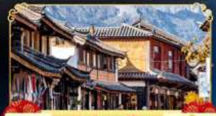
เมืองโบราณไป๋ซา