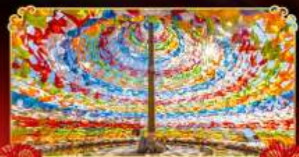
รมนต้อธิฐาน

พิธีต "ภูเขาหิมะมังกรหยก" หนึ่งในสถานที่ท่องเที่ยวระดับ 5A