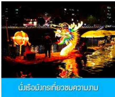
นั่งเรือมังกรเที่ยวชมความงาม