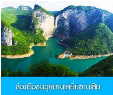
ล่องเรือชมอุทยานเหี้ยซานเสี๋ย