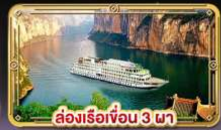
ล่องเรือเขื่อน 3 ภา