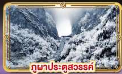
ภูผาประตูสวรรค์