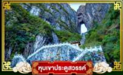
ทิวเขาประตูสวรรค์