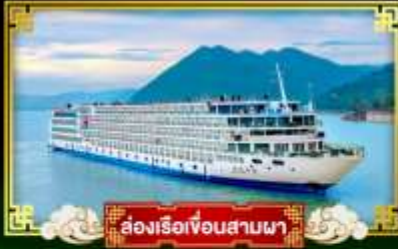
ล่องเรือเขื่อนสามผา