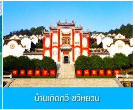
บ้านเกิดกวี ชวีหยวน