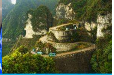
เส้นทาง 99 โค้ง