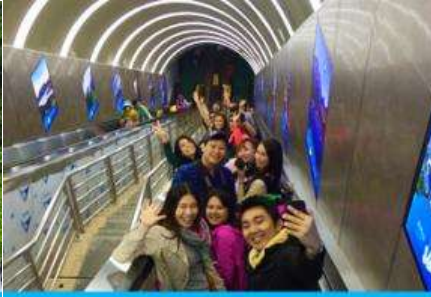
บันไดเลื่อนทะลุภูเขา