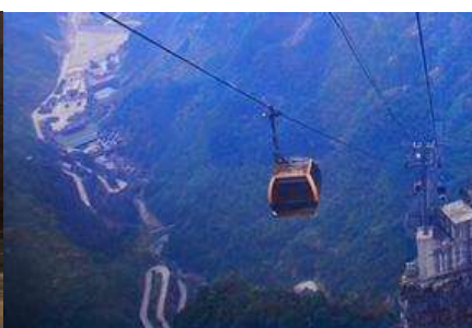
กระเช้าขึ้นเขาเทียนเหมินซาน