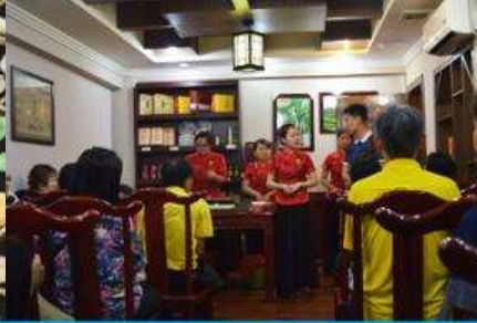
ร้านใบชา