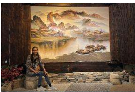
พิพิธภัณฑ์ภาพเขียนหีนทราย

พักที่ ZHENMIAN HOTEL OR YINXIANG HOTEL ระดับ 4 ดาวท้องถิ่นหรือเทียบเท่าในเมืองจางเจียเจีย