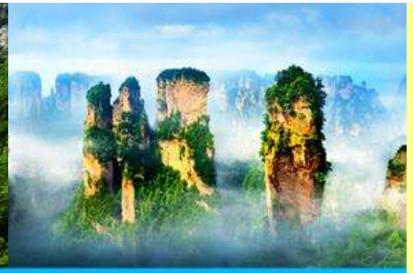
ภูเขาอวตาร

โปรแกรมเสริมที่ 2 โปรแกรมเที่ยวชมอุทยานภูเขาอวตารแบบครึ่งวันที่รวมค่าขึ้นลิฟท์แก้ว (ผู้เข้าร่วมขั้นต่ำ 15 ท่าน) ใช้เวลาประมาณ 4-6 ชั่วโมง (ขึ้นอยู่กับจำนวนนักท่องเที่ยวในแต่ละวัน) อัตราค่าบริการท่านละ 750 หยวนหรือ 3,750 บาท นำท่านเที่ยวชมจุดชมวิวลำธารจีนเปียนซีที่สามารถมองเห็นวิวยอดเขาอวตารได้ชัดเจน นำท่านเที่ยวชมจุดชมวิวมณฑลฉานชมวิวน้ำลิฟท์แล้วไปหลมที่สามารถมองเห็นทัศนียภาพของภูเขาอวตารและลิฟท์แก้วได้ชัดเจน นำท่านขึ้นลิฟท์แก้วขึ้นสู่ยอดเขาอวตาร นำท่านเดินชมจุดชมวิวด่าง ๆ บนยอดเขาอวตารได้แก่ภูเขาฮาเลอูย่า สะพานหนึ่งในได้หล่า... อัตราค่าบริการรวม ค่าบัตรเข้าอุทยาน ค่ารถรับส่งภายในเขตอุทยาน ค่าน้ำเที่ยวของไกด์ท้องถิ่น