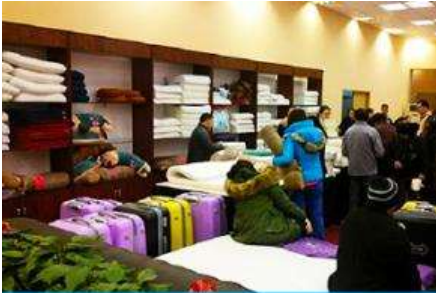
ศูนย์จำหน่ายผลิตภัณฑ์ยางพารา

พักที่ ZHENMIAN HOTEL OR YINXIANG HOTEL ระดับ 4 ดาวท้องถิ่นหรือเทียบเท่าในเมืองจางเจียเจี๋ย