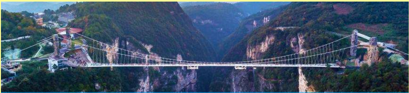
สะพานกระจกข้ามหุบเขาแกรนด์แคนยอน

โปรแกรมเสริมที่ 2 โปรแกรมเที่ยวชมอุทยานภูเขาอวตารแบบครึ่งวันที่รวมค่าขึ้นลิฟท์แก้ว (ผู้เข้าร่วมขั้นต่ำ 15 ท่าน) ใช้เวลาประมาณ 4-6 ชั่วโมง (ขึ้นอยู่กับจำนวนนักท่องเที่ยวในแต่ละวัน) อัตราค่าบริการท่านละ 750 หยวนหรือ 3,750 บาท นำท่านเที่ยวชมจุดชมวิวลำธารจีนเปียนซีที่สามารถมองเห็นวิวยอดเขาอวตารได้ชัดเจน นำท่านเที่ยวชมจุดชมวิวมณฑลฉานชมวิวน้ำลิฟท์แล้วไปหลมที่สามารถมองเห็นทัศนียภาพของภูเขาอวตารและลิฟท์แก้วได้ชัดเจน นำท่านขึ้นลิฟท์แก้วขึ้นสู่ยอดเขาอวตาร นำท่านเดินชมจุดชมวิวด่าง ๆ บนยอดเขาอวตารได้แก่ภูเขาฮาเลอูย่า สะพานหนึ่งในได้หล่า... อัตราค่าบริการรวม ค่าบัตรเข้าอุทยาน ค่ารถรับส่งภายในเขตอุทยาน ค่าน้ำเที่ยวของไกด์ท้องถิ่น