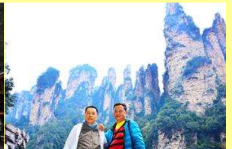
ชมจุดชมวิวลีฟท์แก้ว

โปรแกรมเสริมที่ 1 โปรแกรมเที่ยวชมอุทยานภูเขาอวตารแบบลิฟท์ที่ไม่ขึ้นลิฟท์แก้ว (ผู้เข้าร่วมขั้นต่ำ 15 ท่าน) ใช้เวลาประมาณ 2-3 ชั่วโมง อัตราค่าบริการท่านละ 400 หยวนหรือ 2,000 บาท นำท่านเที่ยวชมจุดชมวิวลำธารจินเปียนซีที่สามารถมองเห็นวิวยอดเขาอวตารได้ชัดเจน นำท่านเที่ยวชมจุดชมวิวจินเปียนซี ลานชมวิวลีฟท์แก้ว ไปหล่งที่สามารถมองเห็นทัศนียภาพของภูเขาอวตารและลิฟท์แก้วได้ชัดเจน (ไม่ได้รวมค่าขึ้นลิฟท์แก้ว) อัตราค่าบริการรวม ค่าบัตรเข้าอุทยาน ค่ารถรับส่งภายในเขตอุทยาน ค่าน้ำเที่ยวของไกด์ท้องถิ่น