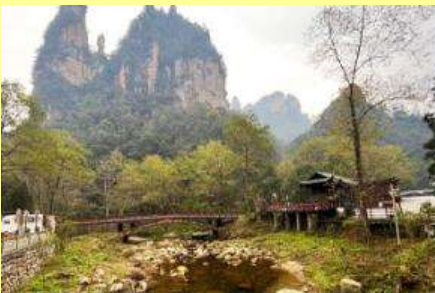
จุดชมวิวจินเปียนซี

หลังอาหารเช้าให้ท่านพักผ่อนตามอัชฌาศัยในโรงแรม หรือ ท่านสามารถเลือกซื้อโปรแกรมเสริม OPTIONAL TOUR รายการใดรายการหนึ่ง ซึ่งเป็น โปรแกรมท่องเที่ยวที่ไม่ได้รวมอยู่ในรายการท่องเที่ยว ซึ่งมีด้วยกัน 3 โปรแกรม ได้แก่