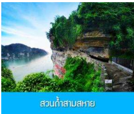
สวนถ้ำสามสหาย