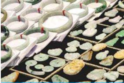
ศูนย์จำหน่ายผลิตภัณฑ์หยก

อัตราค่าบริการสำหรับโปรแกรมเสริมการแสดงชุด The love Story of Wooden man and Fairy Fox ท่านละ 400 หยวน (หรือ 2,000 บาทขึ้นอยู่กับอัตราแลกเปลี่ยน) ระยะเวลาที่ใช้ในการเที่ยวชมการแสดง ประมาณ 3 ชั่วโมง รวมเวลาเดินทางไป กลับค่าบริการรวม ค่าบัตรเข้าชม ค่ารถรับ ส่ง และค่าน้ำเที่ยวของไกด์ท้องถิ่น พักที่ ZHENMIAN HOTEL โรงแรมระดับ 4 ดาวหรือเทียบเท่า