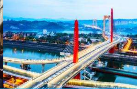
เมืองหยี่ชาง

วันที่ห้า เมืองจางเจี๋ยเจี๋ย- เลือกซื้อโปรแกรมทัวร์เสริม OPTIONAL TOUR - ร้านหยก-ร้านใบชา-เมืองหยี่ชาง