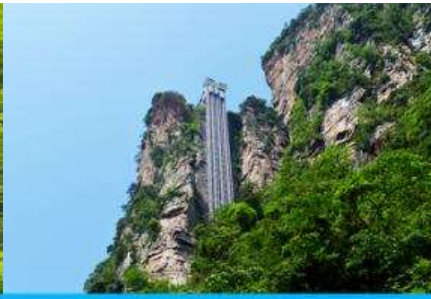
ลิฟท์แก้วไปหลม