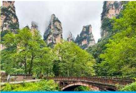
จุดชมวิวจิบเปียนซี