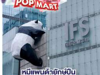
หมีแพนด้ายักษ์เป็น ตักถนนซุนซีลู่