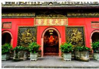
วัดต้าฉีอู๋