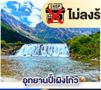
อุทยานปักฝิ่งโกว