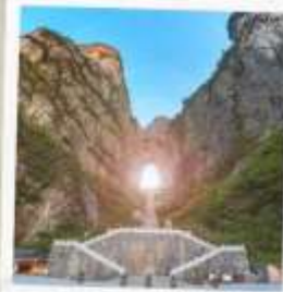
เทียนเหมินซาน