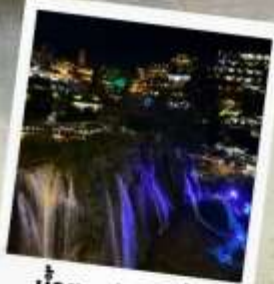
น้ำตกฟูหรงเจิน