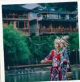
ชุดพื้นเมืองฟิ่งหวง