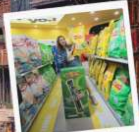
SNACK BUSY STATION