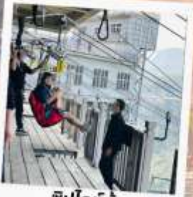
ซิปไลน์ข้าม แกรนด์แคนยอน