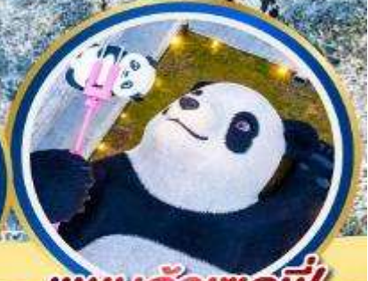
แพนด้าเซลฟี