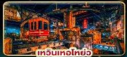
เทียนเหอหยอ