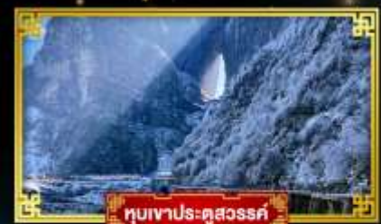
ทิวเขาประตูดสวรรค์